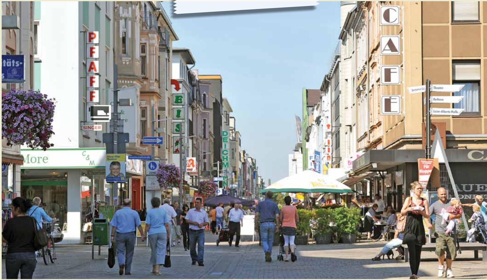
Lebendige, kreative Innenstadt rund um den Altmarkt